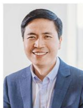
朱松纯 北京大学智能学院 讲席教授、院长