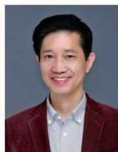
陈宝权 北京大学智能学院 教授、副院长