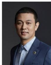
李斌 蔚来汽车 创始人&CEO