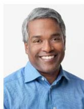
Thomas Kurian Google Cloud CEO