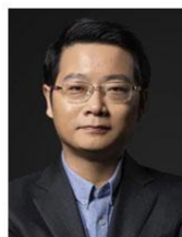
管清友 经济学家 如是金融研究院院长