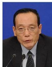
刘世锦 全国政协经济委员会副主任 国务院发展研究中心原副主任