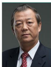
姚景源 著名经济学家 国务院参事室特约研究员